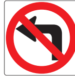
No left turn Поворот налево запрещен