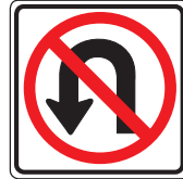
No U-turn Разворачиваться запрещается