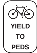
Yield to Pedestrians Уступи дорогу пешеходам