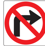
No right turn No girar a la derecha