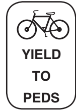
Yield to Pedestrians Ceda a los peatones