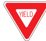
Yield Ceda la via