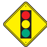
Traffic Signal Señal de trafico