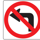
No left turn No girar a la izquierda