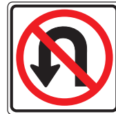
No U-turn No girar atras