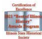
El Premiado: Volúmen 2