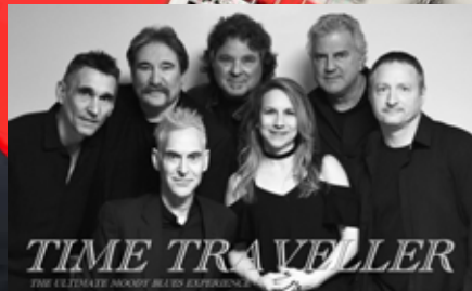
Aug. 19: Time Traveller, with Polarizer