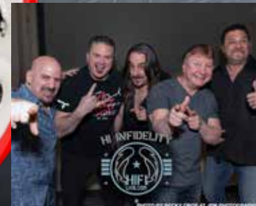
Aug. 26: Hi Infidelity, with Nevery Brothers

Rock 'n Wheels, la serie de conciertos de verano característica del Village de Addison, ¡inicia la décima temporada el 1 de julio!