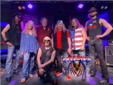
July 1: Free Byrd, with Almost Brothers and Fireworks Finale