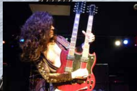
July 29: Kashmir, with Shade of Blues