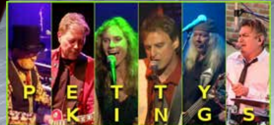
July 15: Petty Kings, with Sonic Road Trip